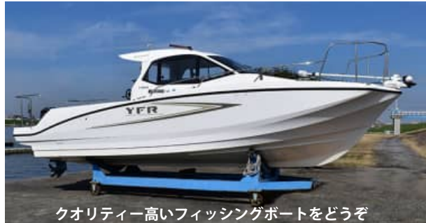
クオリティー高いフィッシングボートをどうぞ

通常 250 馬力が 300 馬力エンジン搭載! MINN KOTA i-PILOT 36V 仕様も搭載!