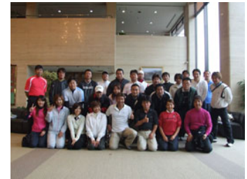
第2回ゴルフコンペ 大栄カントリーにて