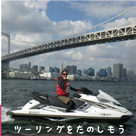
ツーリングをたのしもう